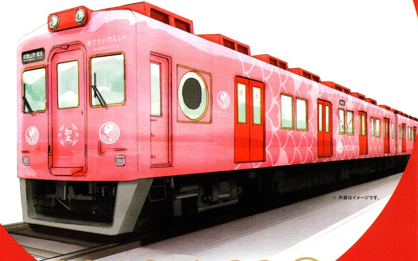
※外装はイメージです。